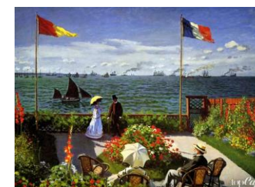
«Терраса в Сент-Адрессе», 1867г.

после её покупки неизвестным любителем живописи была скрыта от посторонних глаз более 70 лет. Этому полотну суждено было стать самым дорогим на лондонских торгах: его оценили в 54 миллиона долларов.