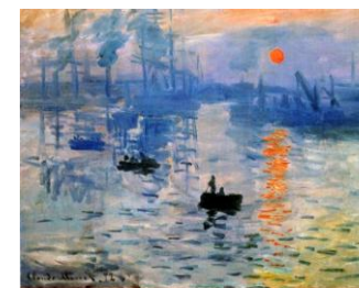
«Впечатление. Восход солнца», 1872г.

Название картины стало судьбоносным. Художник горячо верил, что пришло время для новой